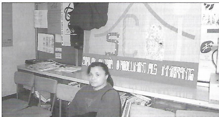
Sala d'espera del SCAI.

sol·licitar-lo és del 27 de gener passat al 23 d'abril. A la província de Barcelona s'han adjudicat 4.700 places (les mateixes que l'any passat). L'oferta és totalment insuficient per la demanda que hi ha. Encara no ha acabat el termini i ja està saturat. Des del SCAI ja s'estan presentant expedients que no