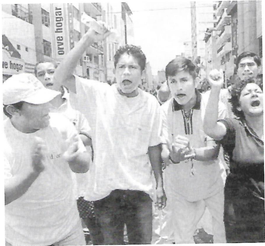
Manifestacions contra el govern de Mahuad a Guayaquil.

Aquesta situació afecta, lògicament, a tots els habitants d'aquests països, però la veritat és que, com sempre, els qui la pateixen més en profunditat i sobre els qui recau el major pes de la desastrosa situació són les