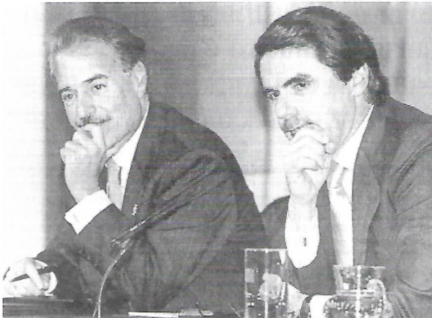
Andrés Pastrana durant la seva recent visita a l'estat espanyol.

No hi ha cap dubte que el camí de Pastrana en aquests moments no és fàcil. Parla de posar en pràctica un pla de desenvolupament amb la justícia social com a eix central i afirma que "los ricos tendrán que meterse la mano al bolsillo. Todos tendremos que aportar, porque la paz nos corresponde a todos". Són paraules boniques. Són intencions bones, però aniran més enllà? O es quedaran tan sols en paraules? El cert és que el poble colombià, els camperols, i els habitants dels sectors populars de les grans ciutats no poden viure de paraules i bones intencions ni menys seguir patint la duresa que prové d'un sistema econòmic que els explota i els impedeix accedir als mínims que tot ser humà requereix per viure.