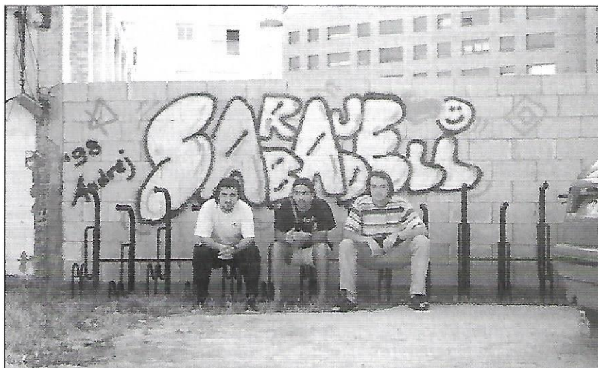
Tres membres del grup de joves de Sarajevo davant del "graffiti" que ens van deixar a Ca l'Estruch.

d'ara l'entitat no està liderada per una ONG estrangera sinó que es tracta d'una associació pensada, formada i gestionada realment pels joves del barri, la iniciativa contribuirà també a fer-los molt més responsables del projecte i a comprometre'ls en la reconstrucció del seu país, a partir de la reconstrucció del teixit associatiu.