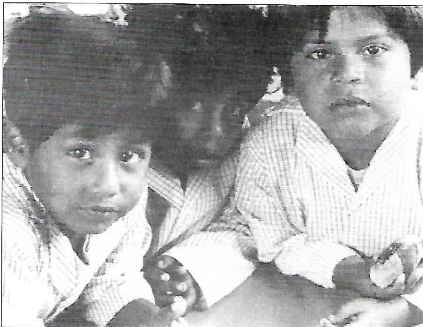
Nens del carrer a una casa d'acollida a Lima. Els nens són el sector de població més afectat per la misèria al Perú.

No van a l'escola i no acostumen a treballar. Sobreviuen demanant almoines o practicant una de les 12