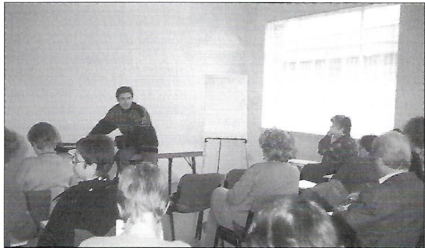
Seminari Ètica i Política (foto d'arxiu).

El temari es divideix en sis punts: 1-Què és l'ètica?, 2-Ètica i política. Què en podem esperar?, 3-Del moralista polític al polític moral. Maquiavel, Kant i Weber, 4-Les