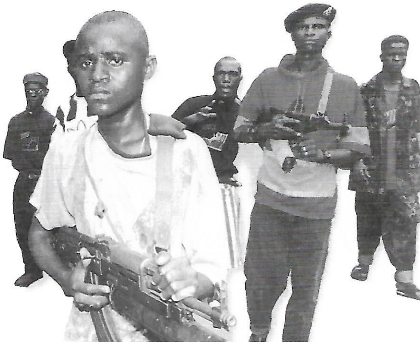
Joves rebels porten el terror a Freetown, capital de Sierra Leone.

Al Txad, també, dos periodistes del bimensual privat L'Observateur van ser condemnats el desembre passat a pagar 500.000 francs CFA cadascun (unes 125.000 pessetes) i a complir un any de presó. El seu delictes: