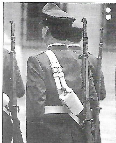
Les forces militars segueixen éssent un perill per a les democràcies llatinoamericanes.

En una de les seves darreres declaracions va dir que "si los miembros de la Corte Suprema que dictaron la sentencia en mi contra no presentan su renuncia pronto, yo mismo me encargaré de sacarlos a patadas." Les seves paraules