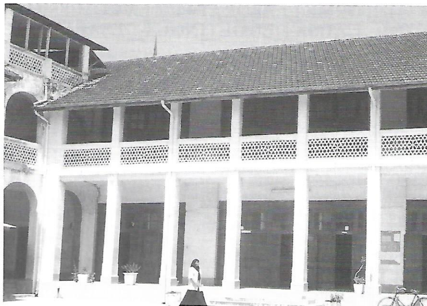
Pati de l'Institut de Suahili i Llengües Estrangeres.

L'Illa de les Espècies, porta d'entrada dels grans exploradors a partir de mitjans del segle XIX -Speke, Burton, Livingstone, Stanley...- i antic protectorat britànic, arrossega el trist passat esclavista amb un dissortat protagonisme. Sota el domini del sultanat omaní, més de 5000 esclaus arribaven cada any a l'illa procedents de l'interior carregat d'ivori. En plena campanya dels anglesos per fer efectiva l'abolició legal del tràfic d'esclaus, a principis de segle, 8.000 esclaus anuals seguien arribant a Zanzibar, la majoria via Bagamoyo,