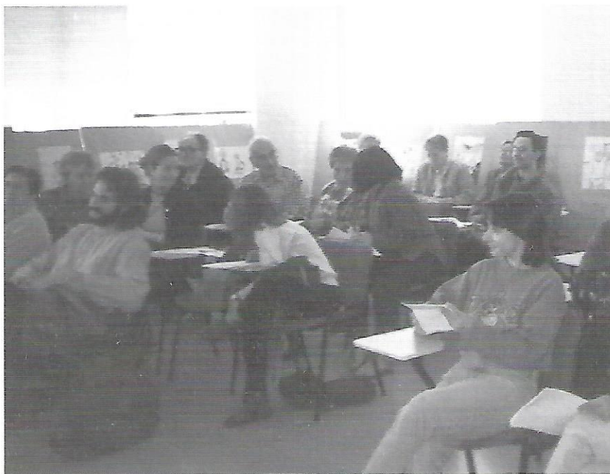
Un moment de la Jornada de Reflexió de la Lliga.

Per tercer any consecutiu, la Lliga dels Drets dels Pobles va organitzar una jornada de reflexió el passat dissabte 7 de novembre, a la qual estaven convidats tots els socis de la Lliga. Enguany, la trobada va tractar principalment de les millores que caldria efectuar a l'entitat, tant en l'organització interna com en la projecció externa o el compromís personal dels seus membres.