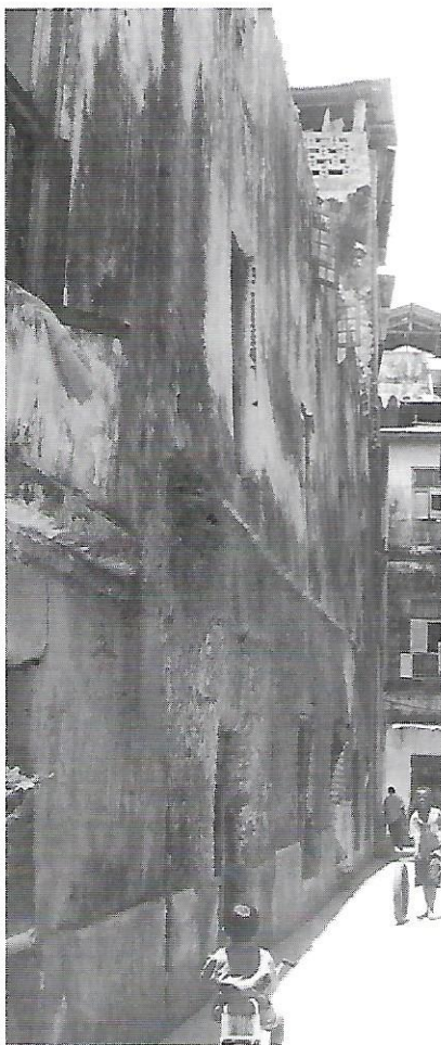
Carrers de la Ciutat de Pedra de Zanzibar Town.

L'economia, per exemple, s'ha ressentit de la caiguda del preu del clavell al mercat internacional. Temps enrera, cap a la segona meitat del