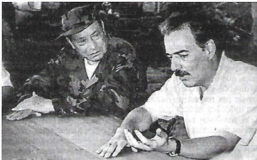
Manuel Marulanda i Andrés Pastrana negociant en un lloc apartat de la selva colombiana.

Ara que ja ha pres possessió del seu càrrec de president (el 7 de novembre), el país espera amb certa ansietat les primeres passes negociadores envers la pau. El poble colombià està cansat de conviure tant de temps amb la violència, amb la guerrilla i la contraguerrilla; amb la producció de coca que guerrillers i contraguerrillers defensen perquè viuen d'ella; amb la corrupció; amb l'existència de grups paramilitars i cossos de seguretat privats al servei del amos de la droga que controlen grans extensions