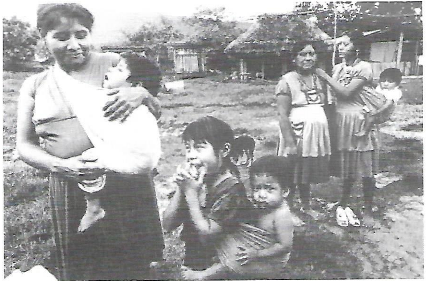
Dones i nens en un poblat de la selva en la zona de Chiapas

D'acord amb el comunicat, el govern del president Zedillo i el Partit Revolucionari Institucional, no tenen aparentment intenció d'aturar aquesta onada d'agresions, ni desitgen la solució del problema principal a Chenalhó, que és la desaparició dels grups paramilitars i permetre el retorn dels indígenes desplaçats a les seves comunitats. "Mientras finge dialogar, el priismo chiapaneco se dedica al saqueo y destrucción de las pertenencias de los expulsados