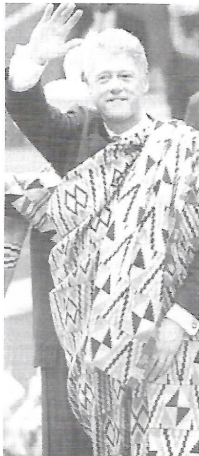
Bill Clinton durant la seva visita a Ghana

L'itinerari de Clinton té de positiu, de moment, el clar intent de "posar Àfrica en el mapa". Una manera de dir que les cartes africanes també formen part de la baralla. Ara només falta saber com jugaran a la partida. És de suposar que Clinton ha de temptejar abans els respectius dirigents africans i descobrir fins a quin punt són garantida d'estabilitat en una zona tan curta en cops d'estat violents i conculcació dels Drets Humans. Mante-