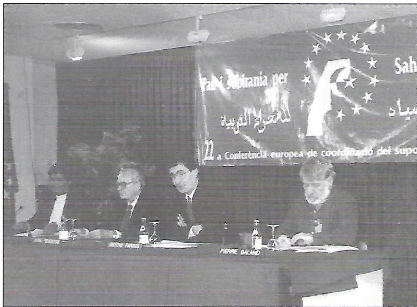
Inauguració de la 22a Conferència de coordinació del suport al Poble Sahrauí (Sabadell, 15 de novembre)

Actualment, hi ha més població sahrauí als territoris ocupats pel Marroc que als campaments. Aquest col·lectiu està patint una forta repressió i una violació constant dels drets humans. En aquest sentit, els assistents a la conferència comentaven