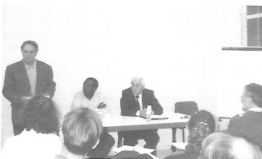
Seminari sobre l'Àfrica Negra a Ca l'Estruch.

A més, es van organitzar dues conferències-debat al Casal Pere Quart sobre la situació dels països dels Grans Llacs i el paper de la Comunitat Internacional en el conflicte.