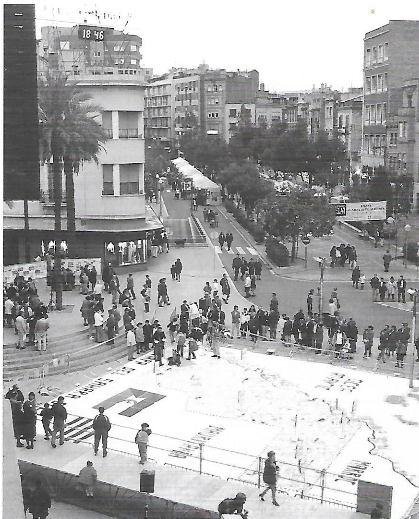
Construcció d'un mapa del Sàhara a la Plaça Doctor Robert de Sabadell (24 de març de 1996)

Al febrer del 1995, discrepàncies de criteris en la línia a seguir provoquen que un grup de persones abandonin l'ACAPS i formin a Sabadell l'ONG "Solidaris amb el Poble Sahrauí".