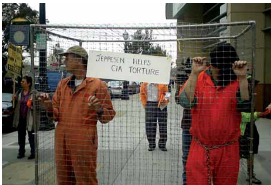
Amb la suposada amenaça de la immigració, diversos països europeus estan negant sol·licituds d'asil a diverses persones en situació de risc en el seu país d'origen.

De manera més escandalosa, la lluita contra el terrorisme també ha donat lloc a pràctiques tan increïbles per part