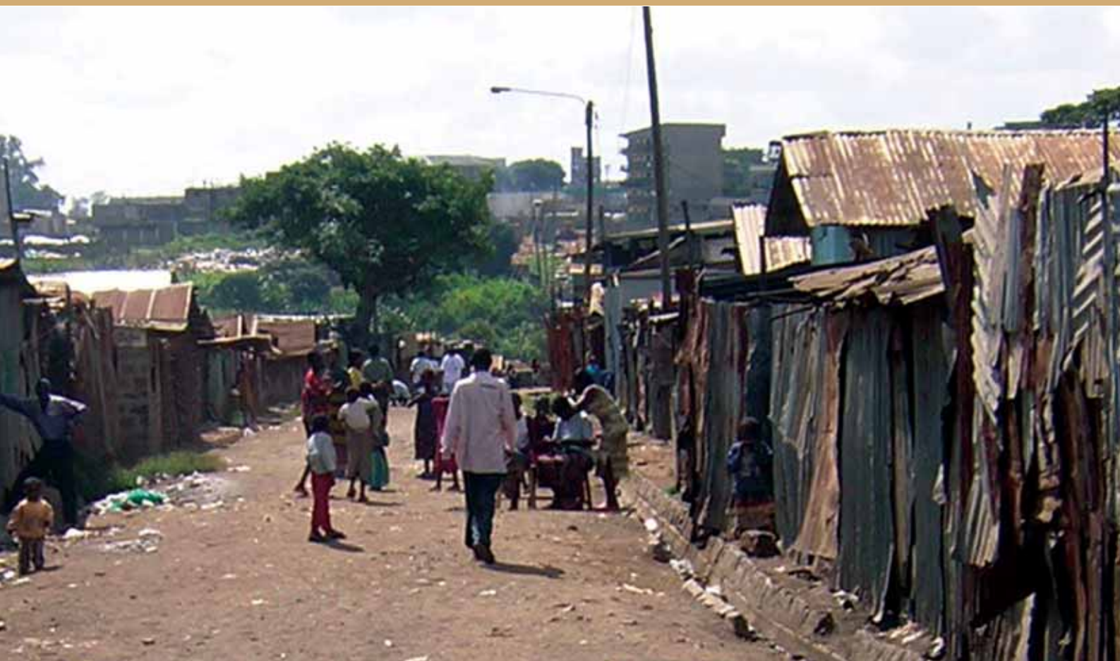
La densitat de població del barri de Kibera és de 4.000 persones per hectàrea. Tot i pertànyer a la capital, les inversions són nul·les pel que fa al sanejament, a les xarxes elèctriques, etc.

grans de l'Àfrica, amb una població de prop d'1 milió d'habitants, i dels quals, només 150.000 estan empadronats en el mateix territori. Això significa que en les eleccions del 2007 només va poder votar un 15% de la població, ja que la resta no tenia capacitat econòmica per marxar a votar als seus pobles, on estan empadronats.