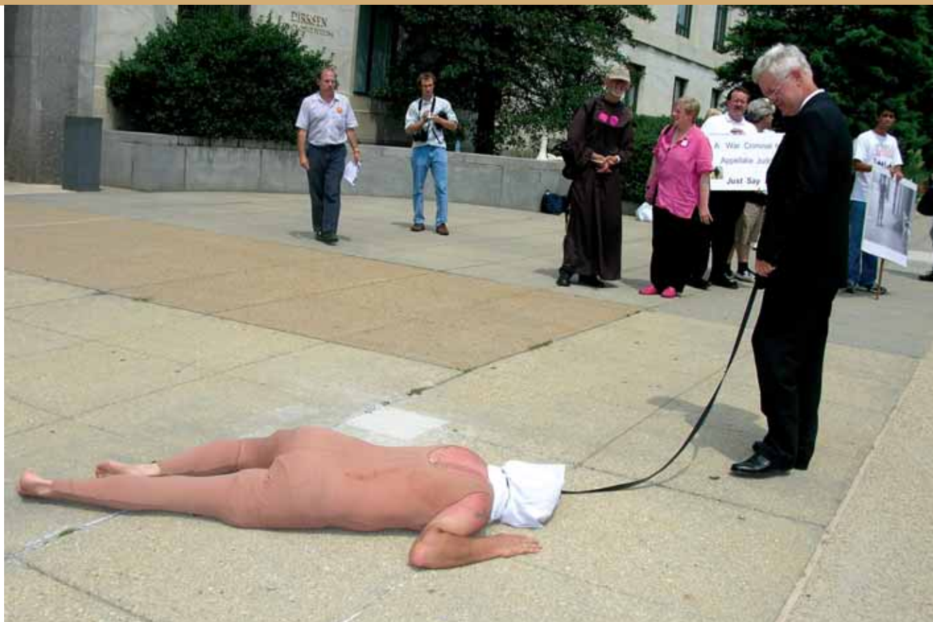
Diverses ONG han denunciat casos d'abusos per part de les forces de seguretat de diferents països

Per no anar més lluny, en el seu últim informe la Coordinadora per a la Prevenció de la Tortura, recull 610 denúncies de maltractaments a tot l'Estat espanyol durant el 2006 1 . Altres ONG internacionals de defensa dels drets humans també han denunciat casos d'abusos per part de les forces de seguretat del país així com la falta de mesures eficaces per prevenir aquests abusos i no deixar espai per a la impunitat 2 .